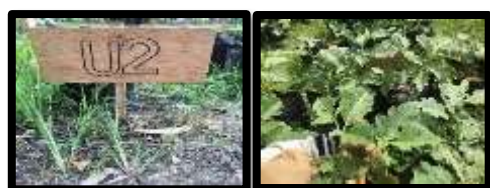
Gambar 5. Jumlah Buah Tanaman Terong Gelatik