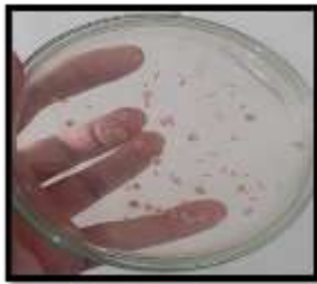
Gambar 9. Analisis Jumlah Bakteri 30 ml / perlakuan

Analisis jumlah bakteri ini dilakukan setelah penelitian di lapangan terlaksana. Penelitian ini dilakukan pada dosis PGPR 30 ml/polybag. PGPR digunakan sebagai pemupukan susulan tanaman terong gelatik ( Solanum melongena L.) ini diteliti guna untuk mengetahui jumlah bakteri yang ada di dalamnya. Hal ini dilakukan untuk membandingkan dengan dosis PGPR 15 ml/polybag. Penelitian bakteri PGPR dilaksanakan di Laboratorium Mandiri, Delegan – Panceng, Gresik, Jawa Timur. Penelitian bakteri pada PGPR dilaksanakan dengan tingkatan 10^3 pada setiap perlakuannya dan diulang sebanyak tiga kali.