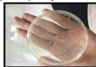
Gambar 8. Analisis Jumlah Bakteri 15 ml / perlakuan

Analisis jumlah bakteri ini dilakukan setelah penelitian di lapangan terlaksana. Penelitian ini dilakukan pada dosis PGPR 15 ml/polybag. PGPR digunakan sebagai pemupukan susulan tanaman terong gelatik ( Solanum melongena L.) ini diteliti guna untuk mengetahui jumlah bakteri yang ada di dalamnya. Hal ini dilakukan untuk membandingkan dengan dosis PGPR 30 ml/polybag. Penelitian bakteri PGPR dilaksanakan di Laboratorium Mandiri, Delegan – Panceng, Gresik, Jawa Timur. Penelitian bakteri pada PGPR dilaksanakan dengan tingkatan 10^3 pada setiap perlakuannya dan diulang sebanyak tiga kali.