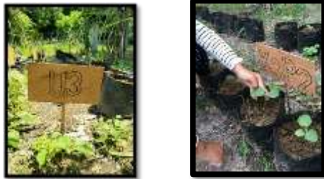
Gambar 3. Jumlah Daun Tanaman Terong Gelatik