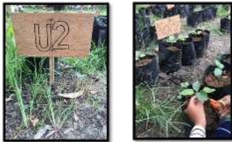
Gambar 2. Luas Daun Tanaman Terong Gelatik

menggunting daun terong gelatik untuk dijadikan sampel atau contoh yang nantinya akan digambar pola daunnya diatas kertas milimeter. Luas daun ditaksir berdasarkan jumlah kotak yang terdapat dalam pola daun yang sudah digambar. Jika 1 kotak penuh atau full maka dihitung 1 tetapi jika 1 kotak tidak penuh maka dihitung ½.