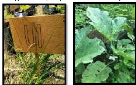
Gambar 4. Jumlah Bunga Tanaman Terong Gelatik

Pengamatan jumlah bunga terong gelatik ( Solanum melongena L.) dilakukan dengan cara manual yaitu dengan menghitung jumlah bunga yang tumbuh pada tanaman terong gelatik sesuai dengan sampel perlakuan. Waktu pengamatan jumlah bunga dilakukan setiap hari dan setiap pagi. Catat jumlah bunga yang sudah dihitung kemudian beri nama sesuai sampel perlakuan agar tidak tertukar dengan sampel perlakuan lainnya.