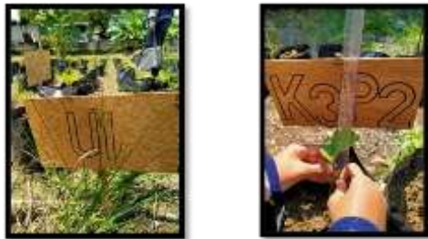
Gambar 1. Tinggi Tanaman Terong Gelatik

Pengamatan tinggi tanaman terong gelatik ( Solanum melongena L.) dilakukan dengan cara mengukur batang tanaman terong gelatik ( Solanum melongena L.) dari bagian permukaan tanah sampai titik tumbuh batang terong gelatik ( Solanum melongena L.). Pengamatan tinggi tanaman dilakukan setiap 2 minggu sekali. Pengamatan dilakukan dengan menggunakan alat penggaris pada sampel tanaman yang sudah ditandai.