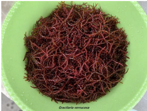
Gambar 2. Bibit rumput laut Gracilaria verrucosa yang digunakan untuk analisis senyawa bioaktif.

Hasil pada Tabel 1 menunjukkan bahwa peningkatan perlakuan biomassa Gracilaria verrucosa dari 100 g hingga 200 g berkontribusi terhadap peningkatan kandungan polisakarida total (agar), dengan nilai tertinggi dicapai pada perlakuan C (200 g) sebesar 32,4 \pm 0,34\% . Namun, pada perlakuan D (250 g), terjadi penurunan menjadi 31,1 \pm 0,54\% , meskipun masih lebih tinggi dibandingkan perlakuan A dan B. Pola ini mengindikasikan adanya titik optimum dalam akumulasi agar, di mana peningkatan biomassa tidak selalu linier terhadap produksi polisakarida. Secara fisiologis, peningkatan kandungan agar hingga titik optimum dapat dikaitkan dengan kapasitas metabolisme sel rumput laut dalam mensintesis polisakarida struktural sebagai respons terhadap kondisi lingkungan dan ketersediaan nutrisi. Agar merupakan komponen utama dinding sel alga merah yang berfungsi dalam menjaga integritas sel serta sebagai cadangan karbon (Armisen & Galatas, 2009). Pada biomassa sedang (200 g), kemungkinan terjadi keseimbangan optimal antara pertumbuhan sel dan biosintesis polisakarida, sehingga akumulasi agar menjadi maksimal. Sebaliknya, penurunan kandungan agar