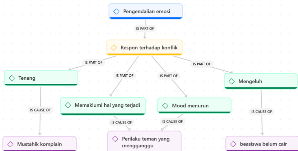
Gambar. 2 (Network respon terhadap konflik)

Selain motivasi, peneliti menemukan adanya respon informan terhadap konflik, dapat diketahui yakni : (1) memaklumi hal yang terjadi, (2) tenang, (3) mengeluh, dan (4) mood menurun/ badmood . Meskipun terdapat sikap seperti mengeluh dan badmood pada informan, mereka memiliki kontrol diri yang baik agar tidak menambah atau memperburuk suasana. Seperti dengan mengingatkan dan berinisiatif agar temannya ikut membantu, hasil pekerjaan yang sering tidak sesuai dengan keinginan atasan/pembina, tidak ambil pusing ketika kegiatan dengan partisipan yang terbilang sedikit, dan suasana hati kembali membaik ketika sudah berkomunikasi lagi dengan pihak yang bermasalah. Hal ini berkaitan teori dari Tangney tentang kontrol diri yang didefinisikan sebagai kemampuan seseorang untuk mengendalikan perilakunya dengan mempertimbangkan nilai, standar moral, dan aturan yang telah ditetapkan oleh masyarakat agar menghasilkan perilaku yang positif. Dan remaja yang memiliki kontrol diri baik memiliki kemampuan untuk mengantisipasi stimulus dari luar dan menghindari perilaku yang melanggar aturan dan norma masyarakat. (Maza & Aprianty, 2022). Berdasarkan hasil wawancara, informan sudah mampu untuk tetap menghasilkan perilaku positif meskipun sempat terbawa emosi karena adanya stimulus dari luar.