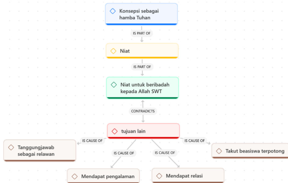
Gambar. 4 (Network niat)

dengan organisasi maupun komunitas lain yang tentunya akan memperluas relasi mereka selama menjadi relawan zakat di Lazismu.