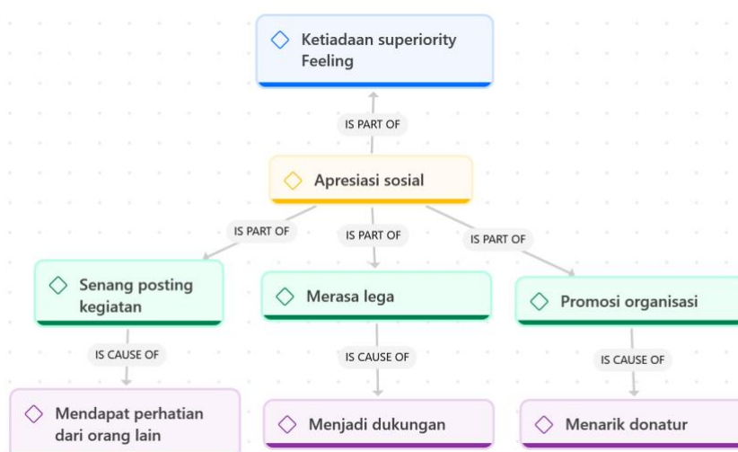
Gambar. 3 (Network apresiasi sosial)

kegiatan itu penting karena dirinya bangga menjadi bagian dari Lazismu Jateng. Dengan mempublikasi/ posting kegiatannya, dirinya berharap orang lain me-notice dirinya kalau informan LY menjadi anggota relawan zakat dari Lazismu Jateng cabang Solo. Hal ini terjadi mungkin agar informan memiliki citra diri yang baik di mata masyarakat atau orang yang mengenalnya. Menurut Omodan dan Abejide, untuk mencapai aktualisasi diri, seseorang harus memenuhi kebutuhan akan harga dirinya terlebih dahulu (Erwanto, 2020). Salah satu elemen internal yang menonjol dari sudut pandang nilai spiritual Islam adalah ikhlas. Salah satu definisi ikhlas adalah ketika seseorang melakukan sesuatu semata-mata karena Allah SWT tanpa mengharapkan pujian atau pengakuan dari orang lain (Muniroh dalam Hasmalawati & Vonna, 2025).