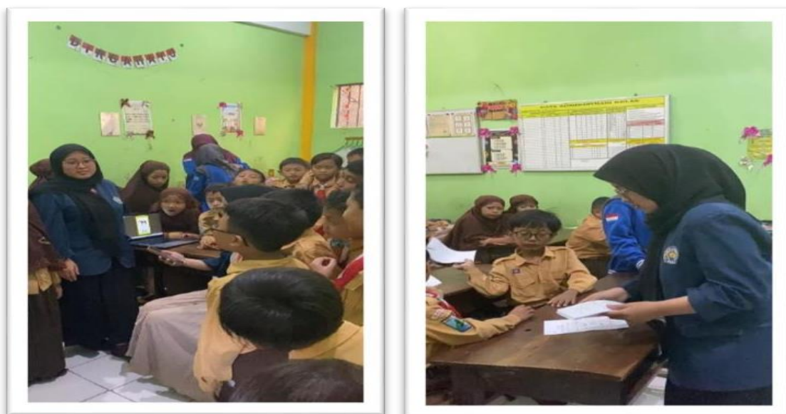
Gambar 3. Kegiatan Pembelajaran di MI Ma'arif Sidomukti