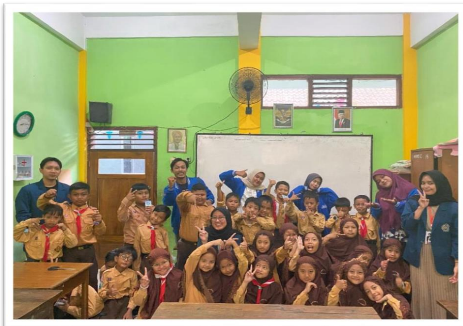
Gambar 2. Kegiatan Observasi Penelitian