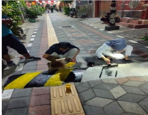
Gambar 5 pelaksanaan pengecatan polisi tidur

Selain itu manfaat yang paling utama adalah kegiatan ini telah merubah total kondisi jalan Kelurahan Bedilan kampung RT 4 RW 2 menjadi lebih indah dan sedap dipandang mata. Kondisi jalanan yang awalnya telah kotor menghitam terkena lintasan waga yang lewat dan faktor cuaca kini telah berubah menjadi lebih menarik. Merekapun menjadi mengerti tata cara proses pelaksanaan pengecatan yang baik dan benar. Kami berharap kegiatan seperti ini akan mereka lanjutkan lagi setelah kami meninggalkan kampung ini.