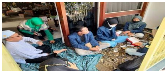
Gambar 2 musyawarah penentuan konsep

berikutnya kami mengunjungi rumah bapak ketua RT 4 RW kamipun menjelaskan program kerja kami Penentuan konsep ini dilakukan supaya kita dapat mengerti keinginan warga dalam warna cat dan model yang mereka inginkan yang nanti akan kita laksanakan. Dalam penentuan konsep ini ini bapak ketua RT mengusulkan memberi cat berwarna hitam dan putih pada bagian paling kiri dan kanan jalan dan untuk polisi tidur menggunakan cat minyak berwarna hitam dan kuning. Penentuan konsep ini perlu memerhatikan kondisi dan keadaan jalan sekitar selain menentukan bagaimana proses pelaksanaannya ini juga bertujuan untuk menghindari hal-hal yang tidak diinginkan sekaligus mengurangi kesalahan dalam pelaksanaan. Ini juga membicarakan tentang kondisi jalan selama beberapa tahun terakhir sekaligus bagaimana upaya warga apakah mereka pernah melakukan perawatan pengecatan sebelumnya supaya nantinya metode pelaksanaan yang kita gunakan akan menjadi tepat .