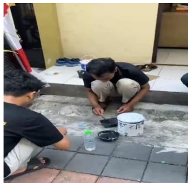
Gambar 3 Teknik pengecatan hari pertama

Untuk pengecatan lampu jalan metode serta tekniknya hampir sama dengan mengecat jalan perbedaannya terletak pada warna yang dipakai untuk lampu jalan sendiri kami menggunakan warna hitam polos dengan mengecat secara keseluruhan. Total ada 8 buah lampu jalan yang kami cat dan dari semua lampu jalan yang ada warna lampu jalan sendiri telah sangat memudar hal itu pun bisa kami mengerti dikarenakan di Kelurahan Bedilan RT 4 RW 2 jumlah laki-laki yang ada sangat sedikit mengingat pengecatan sendiri harus dilakukan banyak orang agar pekerjaan dapat terselesaikan. Selain itu pada saat selesai pengecatan cara yang digunakan untuk membersihkan kuas dan wadah bekas cat yaitu menggunakan air. Yaitu dengan merendam kuas dan mengisi wadah bekas cat tadi dengan air hal ini dilakukan supaya kuas cat tidak kaku mengering komposisi dari cat tembok.