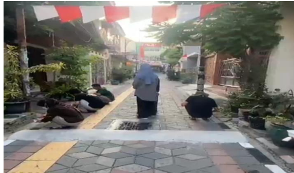
Gambar 4 pelaksanaan pengecatan hari ke 2

sedikit demi sedikit membuat mereka sesekali membantu kami. Kami pun mengajari mereka cara teknik mengecat yang benar sesuai dengan keilmuan kami yaitu perpaduan antara teknik sipil dan dan arsitektur.