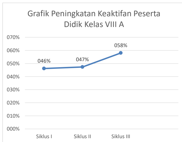
Gambar 1. Persentase Kemampuan Koneksi Matematika Peserta Didik