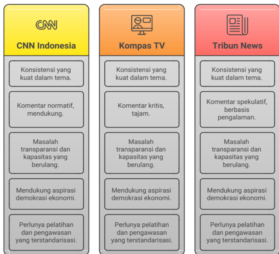
Gambar 2. Triangulasi Komentar Kanal Youtube Tentang Koperasi Merah Putih

terstandarisasi dalam pelatihan, pengawasan, dan sistem insentif koperasi sangat diperlukan. Selain itu, publik juga memberikan sinyal perlunya keterlibatan lembaga eksternal seperti universitas, lembaga audit independen, atau KPK untuk menjaga integritas koperasi. Keberulangan ide-ide ini dalam komentar dari kanal berbeda menunjukkan bahwa rekomendasi tersebut bukan aspirasi elit, melainkan desakan akar rumput yang muncul secara organik. Oleh karena itu, hasil triangulasi bukan hanya mengonfirmasi data tematik, tetapi juga memperkaya daya guna temuan dalam konteks kebijakan publik.