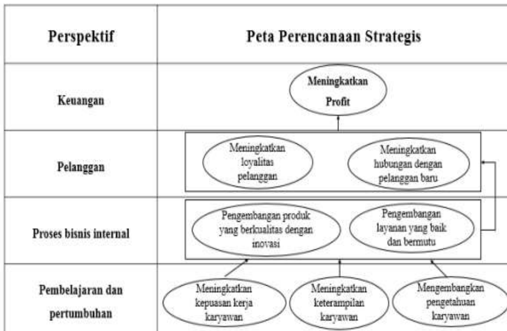
Gambar 2. Peta Strategi (Strategy Map) Kalem Coffee

Penyusunan peta strategis menggambarkan hubungan yang jelas antara empat perspektif pada Kalem Coffee yaitu dimulai dari perspektif keuangan, pelanggan, proses bisnis internal serta pembelajaran dan pertumbuhan yang berdasarkan strategi diversifikasi.