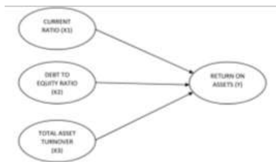
Gambar 3. Kerangka Konseptual