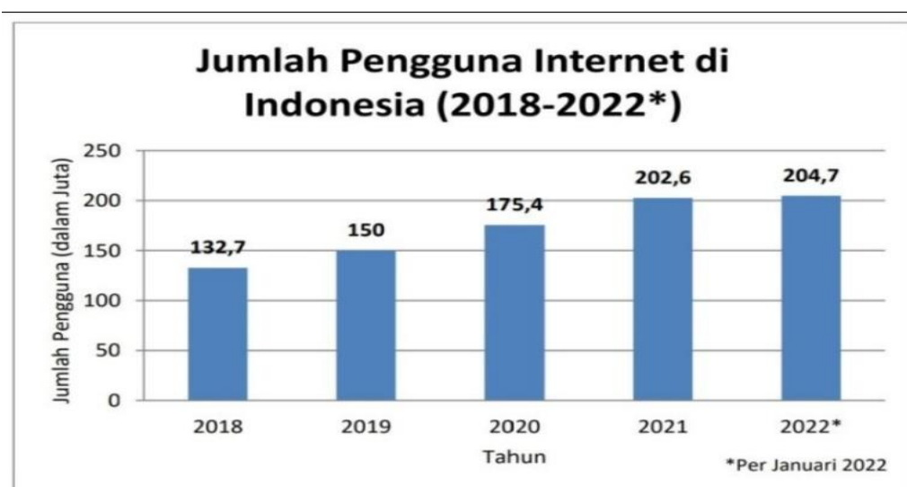
Gambar 1. Grafik Jumlah Pengguna Internet Di Indonesia (2018-2022)

Perbedaan hasil ini ( gap research ) mencerminkan variasi metodologi dan proses penelitian, mendorong peneliti untuk melakukan studi lanjutan guna mendapatkan kesimpulan yang lebih jelas. Penelitian ini berfokus pada pengaruh current ratio , debt to equity ratio , dan total asset turnover terhadap return on asset di sektor telekomunikasi pada BEI tahun 2018-2022.