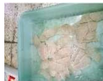
Gambar 3 Hasil Produksi Kerupuk Kentang Menggunakan Mesin

Sedangkan dibawah ini hasil produksi memotong kerupuk kentang menggunakan mesin yang mana antara ketebalan, sisi kanan dan sisi kiri sama teratur.