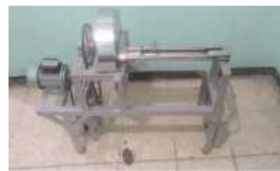
Gambar 2 Alat Pemotong Kerupuk Menggunakan Mesin

Dibawah ini gambar alat pemotong kerupuk kentang menggunakan mesin.