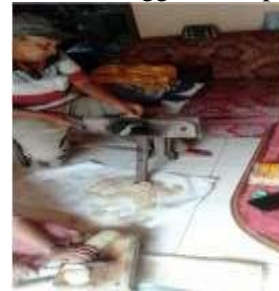
Gambar 1 Alat Pemotong Kerupuk Manual Menggunakan Pisau

Dibawah ini gambar alat pemotong kerupuk secara manual menggunakan pisau.