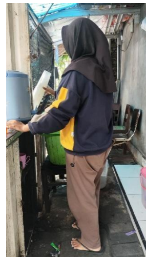
Gambar 3 Mengambil cup