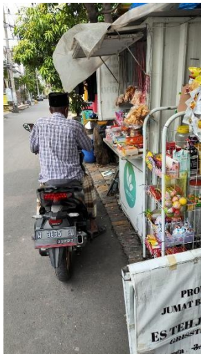
Gambar 1 Kondisi Lingkungan

Dalam melakukan kegiatan, pekerjaan yang sama dilakukan terus-menerus dan tata letak booth yang kurang tertata membuat tubuh mudah terasa tidak nyaman. Beberapa pekerja mengaku sering harus membungkuk sedikit yang cukup lama dan mengulangi gerakan yang sama saat meracik minuman dan juga sering berdiri terlalu lama, sehingga punggung, tangan dan kaki cepat pegal dan lelah. Kondisi ini diperparah oleh jam kerja yang panjang dengan waktu istirahat yang minim, sehingga rasa lelah semakin menumpuk. Jika dibiarkan tanpa perbaikan, situasi tersebut dapat menimbulkan gangguan kesehatan jangka panjang bagi para pekerja. Berikut gambar kondisi lingkungan sekitar pada umkm tersebut