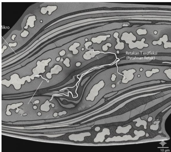
Gambar 2 Mikrostruktur Pamor Wo Wutah Gambar detail ini memvisualisasikan mikrostruktur Pamor Wo Wutah pada keris sebagai hasil dari proses tempa-lipat berulang yang intensif, yang menciptakan Struktur Berlapis Heterogen (Laminasi) yang sangat

halus, terdiri dari lapisan Fe (besi/baja) dan Ni (nikel, bahan pamor). Pola "beras tumpah" ini secara detail dijelaskan oleh distribusi logam nikel yang tidak sepenuhnya homogen dan cenderung terfragmentasi menjadi bintang-bintang diskret dalam matriks Fe. Pada batas antar lapisan, dapat diidentifikasi Zona Difusi Fe-Ni yang tidak simetris daripada garis batas yang tegas zona transisi ini menciptakan variasi kontras visual yang membentuk motif Wo Wutah dan secara metalurgi meningkatkan ikatan antar lapisan. Secara fungsional, sifat Ketangguhan bilah ditingkatkan karena struktur berlapis dan zona difusi yang terfragmentasi ini efektif dalam menciptakan distribusi tegangan yang tidak merata (mekanisme defleksi retak), memaksa retakan mengubah arah dan mencegah patah getas, sementara Kekerasan bilah ditingkatkan secara signifikan oleh Fasa Martensit Keras pada bagian baja bilah (hasil quenching ).