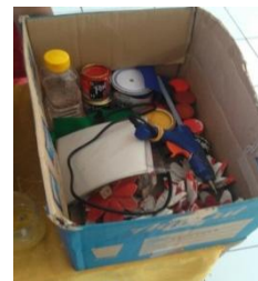
Gambar 1. Alat dan bahan pembuatan bunga dan tempat pensil dari botol bekas

Kegiatan pelatihan tersebut dilakukan di SDN Sukalela dengan jadwal di luar jam sekolah. Sedangkan untuk alat dan bahan yang digunakan untuk kegiatan pelatihan seni kerajinan tangan tersebut diantaranya botol bekas, tempat telur bekas, cat,cait air, tinner, kuas, gunting, cutter, kain flannel, lem tembak, spidol/pen, kertas origami, dan mata boneka.