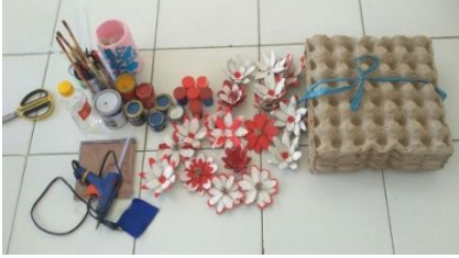
Gambar 2. Alat dan bahan pembuatan bunga dari tempat telur bekas

Untuk kegiatan pelatihan itu sendiri, dilakukan dengan cara sebagai berikut :