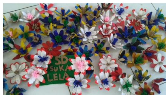
Gambar 8. Hasil Jadi Bunga Dari Tempat Telur Bekas

Pelatihan yang diberikan kepada kepada ke empat kelas di SDN Sukalela tersebut dilaksanakan di luar jam sekolah, tujuannya agar waktu proses pengajaran menjadis menjadi