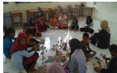
Gambar 7. Pelatihan Pembuatan Bunga dari Tempat Telur

kurang. Oleh karena itu kami memberi pelatihan seni kerajinan tangan dari baarang bekas kepada mereka namun barang bekas yang digunakan adalah tempat telur yang tidak terpakai. Dengan adanya barang bekas tersebut, kami mengajarkan kepada mereka cara membuat bunga yang cantik dari tempat telur. Setelah mereka membuat kerajinan tangan, mereka menjadi tahu bahwa tempat teluryang tidak terpakai bisa diamanfaatkan untuk dijadikan sesuatu yang bernilai estetis. Tentu hal itu menambah pengetahuan serta keterampilan maupun kreativitas mereka. Dan hasil karya tersebut bisa dijadikan hiasan ruangan.