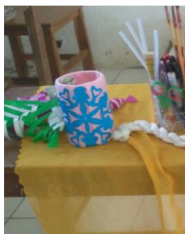
Gambar 6. Hasil Jadi Tempat Pensil

Siswa kelas 5 dan 6 SDN Sukalela juga cukup aktif dan terampi, pengetahuan dan pengajaran seni keterampilan dirasa masih