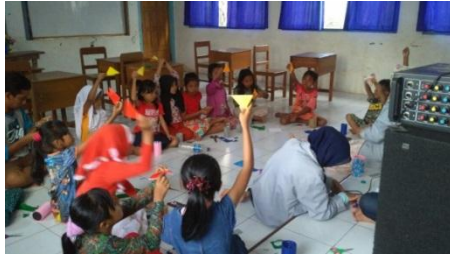
Gambar 4. Pelatihan Membuat Tempat Pensil