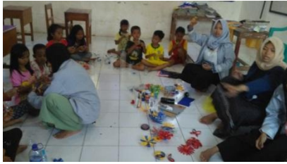
Gambar 3. Pelatihan Membuat Bunga dari Botol Bekas