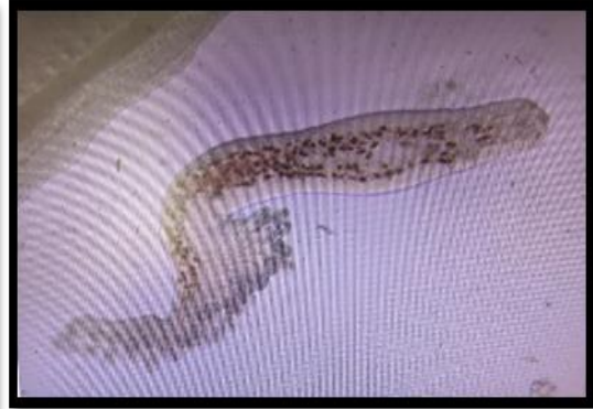
Gambar 3. Pyragraphorus hollisae

Pengamatan tersebut menunjukkan bahwa dari 20 sampel ikan yang diamati, 15 ekor diantaranya terserang parasit, dengan tingkat prevalensi secara keseluruhan pada ikan bawal bintang 70%. Pada ikan Bawal Bintang ukuran besar memiliki nilai prevalensi Benedenia sp. dan Pyragraphorus hollisae , dengan rentang nilai 70-80% yang berarti ektoparasit ini biasanya ada pada setiap ikan Bawal Bintang ukuran besar 15-30 cm dengan setiap prevalensi nya memiliki ciri-ciri umum yaitu menurunnya nafsu makan, berenang lemah, sering menggosokkan badannya ke jaring, ikan menghasilkan lendir yang berlebihan dan insang pucat.