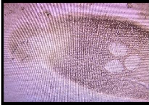
Gambar 2. Benedenia sp.

Hasil pengamatan ektoparasit pada ikan bawal bintang disajikan pada Gambar 2 dan Gambar 3.