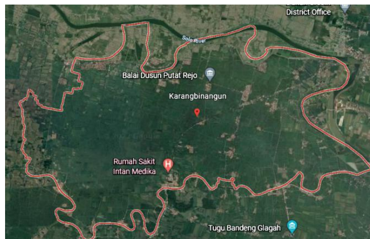
Gambar 2. Peta Lokasi Kecamatan Karangbinangun

Kuisisioner yang digunakan sebagai acuan wawancara adalah petambak, sumber daya alam yang dimiliki, sistem yang dipakai budidaya, motif ekonomi dan bertambak. Sampel pada penelitian ini adalah petambak yang suka rela hadir pada undangan yang disebar melalui ketua kelompok petambak di masing-masing wilayah, sampel pada Kecamatan Deket tersebar dari tiga desa yaitu Sidomulyo, Sugiwaras, dan Weduni, sedangkan sampel Kecamatan Karangbinangun tersebar dari tiga desa pula yaitu Pandowo limo, Sambopinggir, dan Baranggayam. Pengambilan sampel sebanyak 48 Kecamatan Deket dan 59 Kecamatan Karangbinangun orang data responden.