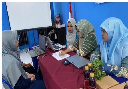
Gambar 6.2 Pendampingan Penyusunan Laporan Pajak

Hasil: Seluruh pengelola yang terlibat dalam pendampingan berhasil menyusun laporan pajak dengan baik, dan semua laporan disampaikan sebelum tenggat waktu yang ditentukan oleh otoritas pajak.