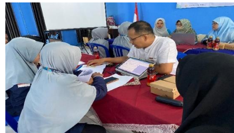
Gambar 6.1 Pendampingan Simulasi Perhitungan Pajak

Hasil: 100% peserta berhasil menyelesaikan simulasi penghitungan pajak badan dan mampu menyiapkan dokumen yang diperlukan untuk pelaporan pajak dalam waktu yang ditentukan. Adapun kegiatan terdokumentasi pada Gambar 6.1 sebagai berikut: