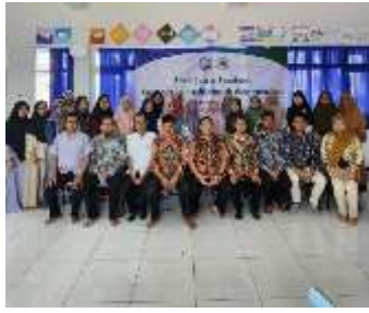
Gambar 4. Kegiatan Pelatihan Pajak di Kabupaten Bojonegoro

Pelaksanaan kegiatan short course di Kabupaten Tuban dilaksanakan serentak dengan Kabupaten Gresik. Kegiatan dilaksanakan selama dua hari pada tanggal 30 Juli 2023 dan 5 Agustus 2023 dan bertempat di PDM Kabupaten Tuban. Materi yang dipaparkan dalam kegiatan short course terdapat enam materi yaitu, dasar-dasar pajak, pajak badan/organisasi, pajak pertambahan nilai (PPN), pajak penghasilan pasal 21 dan 23, koreksi fiskal, dan SPT. Keenam materi tersebut disampaikan oleh dua pemateri yang dibagi menjadi lima sesi disetiap materi.