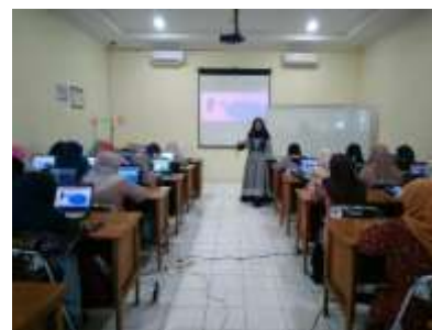
Gambar 3. Kegiatan Pelatihan Pajak di Kabupaten Gresik

minggu setelah pelaksanaan short course di Kabupaten Gresik dan Tuban yaitu selama dua hari pada tanggal 6 Agustus 2023 dan 12 Agustus 2023 dan bertempat di SMP Muhammadiyah 9 Bojonegoro.