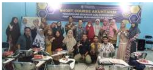
Gambar 5. Kegiatan Pelatihan Pajak di Kabupaten Tuban

Berdasarkan hasil post-test 90% dari peserta pelatihan mampu menjawab pertanyaan dengan kisaran baik sd sangat baik yaitu dengan rentang nilai antara 66 sd 94. Hal tersebut menunjukkan ketercapaian tujuan pembelajaran/pelatihan yaitu bendahara sekolah telah mempunyai pemahaman yang baik tentang pajak, mampu menghitung dan melaporkan kewajiban perpajakan sekolah dengan baik.