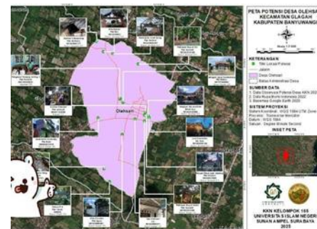
Gambar 1. Peta Wisata Desa Olehsari

juga menjadi langkah awal yang strategis dalam mendorong kemajuan Desa Wisata Olehsari menuju destinasi yang lebih dikenal, terkelola, dan berdampak positif bagi kesejahteraan warganya.