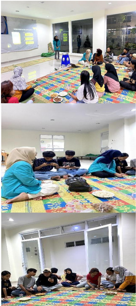
Gambar 2. Dokumentasi Kegiatan Pelaksanaan