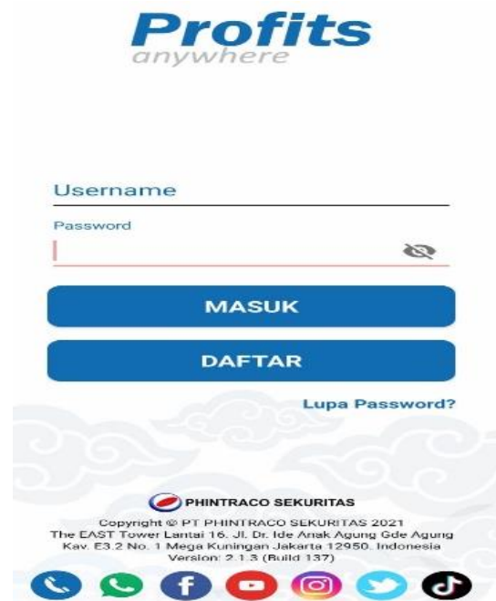
Gambar 3. Akun Profit

Langkah pertama yang dilakukan adalah dengan membuat akun dengan melakukan register di aplikasi "Profits".