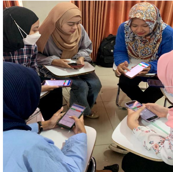
Gambar 2. Dokumentasi Kegiatan

Namun dalam rangka menarik minat generasi milenial untuk mau berinvestasi di pasar modal, pada saat ini untuk bisa melakukan investasi saham cukuplah mudah dan murah. Mereka cukup dengan menjadi nasabah dari perusahaan efek terlebih dahulu, dan menyediakan dana seratus ribu rupiah untuk bisa melakukan trading saham, dalam rangka untuk melatih investasi sejak dini.