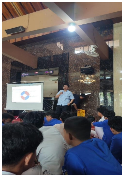
Gambar 1. Pembicara memberikan materi kepada peserta

(2024) yang menyebutkan bahwa motivasi investasi dan akses teknologi mendukung peningkatan minat generasi Z terhadap pasar modal, tetapi pemahaman teknis tetap menjadi faktor kunci dalam pengambilan keputusan investasi.