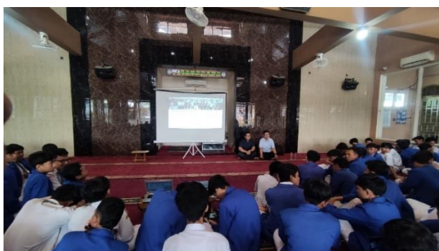
Gambar 2. Peserta antusias mengikuti kegiatan

baik terkait materi yang disampaikan maupun pengalaman pribadi mereka dalam mengelola keuangan. Banyak peserta yang mengungkapkan bahwa mereka sering mengalami kesulitan mengatur uang jajan, tidak memiliki kebiasaan menabung secara konsisten, dan belum pernah membuat rencana keuangan bulanan. Hal ini menunjukkan bahwa kebutuhan edukasi literasi keuangan memang sangat mendesak di kalangan remaja. Beberapa siswa juga mengaku pernah tertarik dengan ajakan investasi melalui media sosial, namun ragu untuk mencoba karena tidak memahami mekanismenya. Keresahan ini relevan dengan sejumlah penelitian (Mu'afi et al., 2024; Kumanireng & Utomo, 2023) yang menemukan bahwa generasi Z rentan terpengaruh oleh promosi investasi tanpa memahami kredibilitas dan risiko instrumen yang ditawarkan.