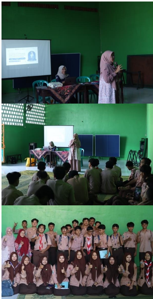
Gambar 1: Dokumentasi kegiatan

Berikut adalah dokumentasi pelaksanaan kegiatan: