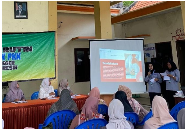
Gambar 1. Konfirmasi kondisi awal pengelolaan keuangan peserta melalui sesi tanya jawab pembuka

Konfirmasi awal ini mempertegas relevansi kegiatan sosialisasi yang dilaksanakan sekaligus menjadi pijakan bagi tim dalam mengarahkan materi agar tepat sasaran. Sebagaimana ditekankan oleh (Indania et al., 2024), ketidakmampuan mengelola keuangan secara terencana tidak hanya berdampak pada kondisi finansial keluarga, tetapi juga berpotensi memicu ketegangan dalam hubungan rumah tangga. Hal ini memperkuat urgensi intervensi edukatif seperti yang dilaksanakan dalam kegiatan ini sebagai langkah preventif yang menyentuh akar persoalan secara langsung.