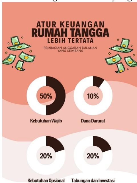
Gambar 2. Diagram Lingkaran Proporsi Anggaran

Visualisasi ini membantu peserta memahami konsep penganggaran secara konkret. Nazmi dkk. (2024) menegaskan bahwa pemahaman tentang penganggaran bertujuan membentuk perilaku keluarga agar mampu menetapkan skala prioritas melalui perencanaan yang tepat. Dengan pembagian ini, ibu-ibu PKK tidak lagi hanya "meraba-raba" keuangan mereka, tetapi memiliki peta jalan ( roadmap ) yang jelas. Selain diagram, tim juga menyajikan Tabel Pencatatan Keuangan Sederhana (Gambar 3). Tabel ini dilengkapi kolom evaluasi untuk mendeteksi pengeluaran kecil yang sering tidak disadari namun berdampak besar terhadap defisit anggaran. Priatna dkk. (2022) menekankan bahwa materi keuangan akan lebih efektif apabila disertai dengan alat bantu yang aplikatif dan mudah digunakan.