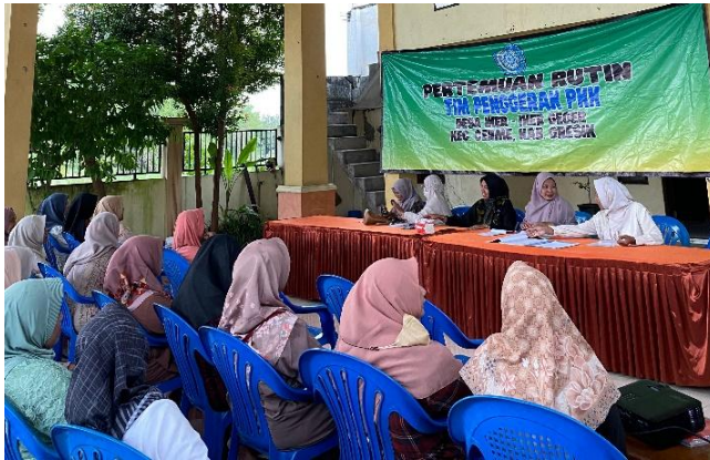
Gambar 4. Antusiasme dan keterlibatan peserta selama kegiatan sosialisasi berlangsung.