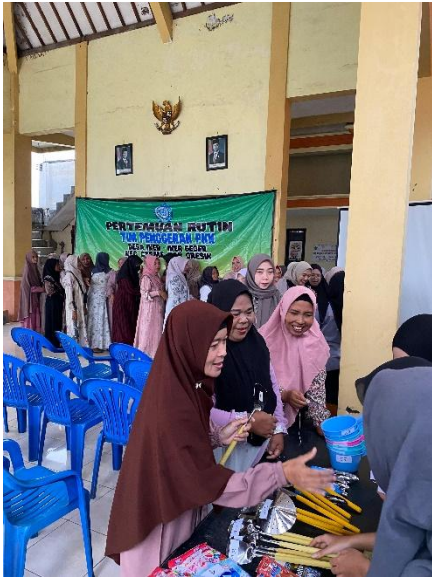
Gambar 5. Sesi permainan tarik hadiah berhadiah