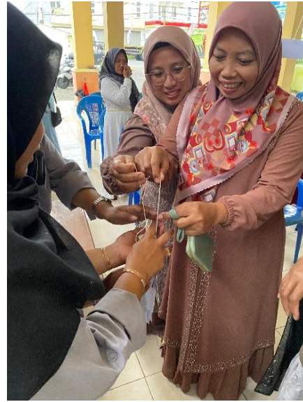
Gambar 6. Pembagian hadiah dari permainan tarik hadiah