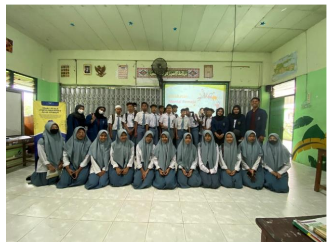
Gambar 3. Foto bersama