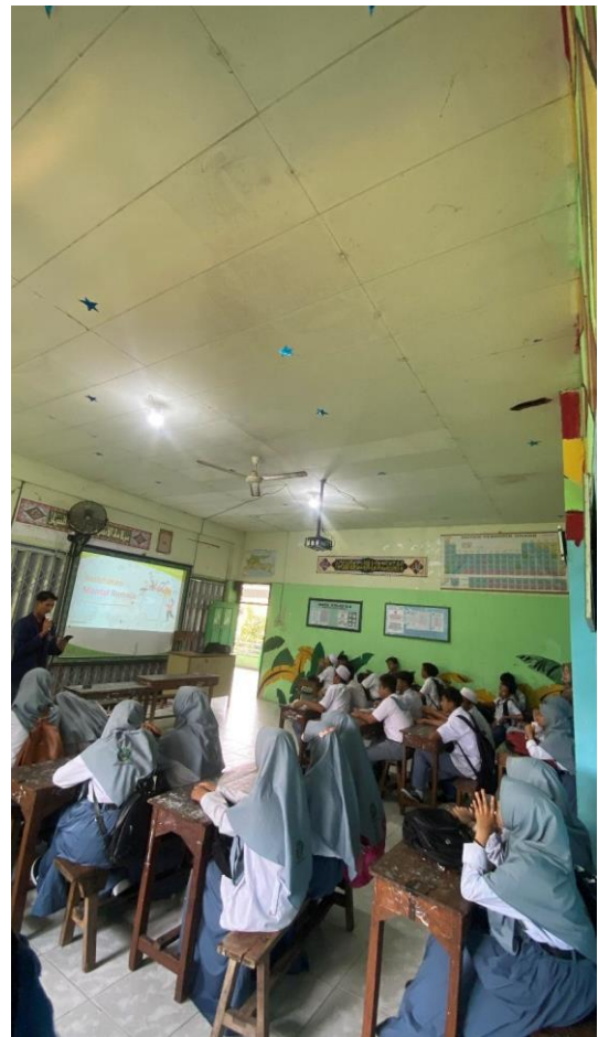
Gambar 2. Kegiatan penyuluhan

Pengabdian kepada masyarakat yang kami lakukan sejalan dengan teori yang dikemukakan oleh Notoadmodjo (2012) yang menjelaskan bahwa seseorang yang mudah menerima informasi adalah individu yang mempunyai pendidikan yang lebih tinggi dan mempunyai pengetahuan yang baik sehingga mudah melakukan perubahan kearah yang lebih baik atau positif.