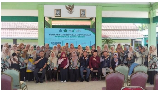
Gambar 1 Dokumentasi Bersama Warga Desa Prasung Kabupaten Sidarjo Tahun 2026

Tahap pelatihan menjadi inti pelaksanaan program. Pelatihan dilakukan dalam bentuk penyuluhan interaktif dan pembelajaran praktis. Sesi pertama membahas literasi keuangan syariah, meliputi prinsip dasar pengelolaan keuangan keluarga, penyusunan anggaran rumah tangga, penetapan prioritas kebutuhan, dan alokasi belanja yang mendukung pemenuhan pangan sehat. Sesi kedua membahas pemilihan pangan bergizi, termasuk pengenalan kebutuhan gizi keluarga, cara memilih bahan pangan sehat yang terjangkau, dan pemanfaatan sumber pangan lokal. Kedua sesi disampaikan secara terintegrasi agar peserta memahami bahwa pemenuhan gizi keluarga sangat dipengaruhi oleh kemampuan mengatur pengeluaran rumah tangga secara tepat. Untuk memperkuat pemahaman, peserta juga menggunakan modul edukasi sebagai media pendukung pembelajaran.