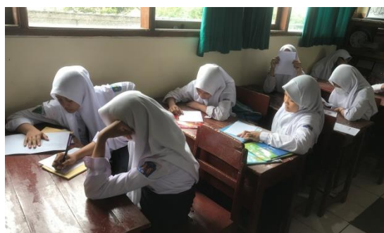
Gambar 4. Pelaksanaan Tes Kemampuan Pemecahan Masalah