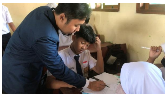
Gambar 2. Guru Membimbing Peserta Didik

Pada setiap siklus, proses pembelajaran sudah lebih baik dibanding dengan pembelajaran siklus sebelumnya walaupun masih perlu perbaikan lagi selanjutnya. Hal ini dapat dilihat dari keaktifan peserta didik saat proses pembelajaran. Pada akhir siklus II, peserta didik sudah mulai terbiasa dengan pembelajaran berkelompok. Peserta didik sudah memahami langkah-langkah pembelajaran yang dilakukan. Peserta didik sudah tertib dan tidak bingung dengan apa yang harus dilakukan saat berkelompok. Mayoritas peserta didik aktif berdiskusi dan bertanya kepada guru dalam menyelesaikan LKPD yang diberikan. Rata-rata nilai Kemampuan Pemecahan Masalah (KPM) peserta didik juga mengalami peningkatan.