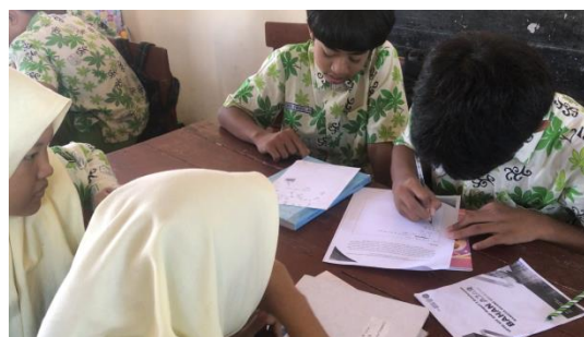
Gambar 3. Kegiatan Diskusi