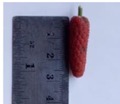
Gambar 1. Buah cabe jawa

Pemeriksaan makroskopis dan mikroskopis merupakan langkah awal sebelum melakukan identifikasi dan penetapan tingkat kemurnian suatu bahan. Inspeksi visual menjadi cara termudah dan tercepat untuk menetapkan identitas, kemurnian, dan kualitas. Jika sampel ditemukan berbeda secara signifikan dari spesifikasi dalam hal warna, konsistensi, bau atau rasa, maka dianggap tidak memenuhi persyaratan (WHO, 2011). Penampakan visual sampel segar buah cabe jawa terdapat pada gambar 1 berikut: