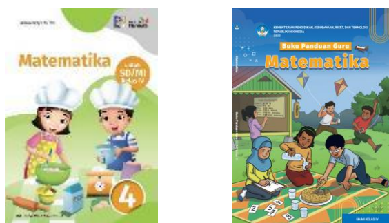
Gambar 2. Bahan Ajar Sekolah A

Untuk memperjelas jenis perangkat pembelajaran yang digunakan dan karakteristik buku teks yang tersedia di sekolah, berikut disajikan gambar sebagai hasil studi dokumen yang dilakukan