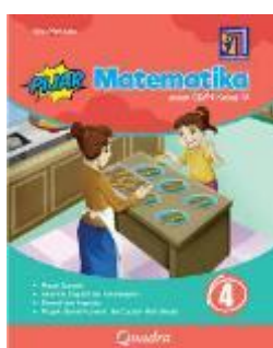
Gambar 3. Bahan Ajar Sekolah B

Gambar 2 dan gambar 3 memperlihatkan jenis buku teks yang digunakan dalam pembelajaran matematika di kelas. Di Sekolah A digunakan dua buku, sementara Sekolah B hanya menggunakan satu. Buku-buku tersebut umumnya menyajikan materi secara ringkas, hanya memuat satu metode penyelesaian perkalian, serta mencampurkan topik perkalian dan pembagian tanpa pemisahan yang jelas. Penyajian materi juga cenderung langsung ke aturan dan soal tanpa penjelasan konsep secara bertahap, dan contoh soal belum tersusun dari tingkat mudah ke kompleks. Padahal, menurut Menurut