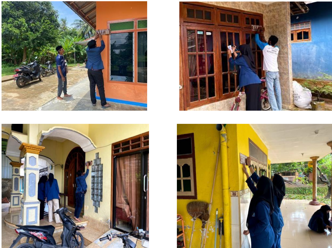
Gambar 2. Pemasangan plakat nomor rumah

Pemasangan plakat nomor rumah terlihat pada gambar berikut: