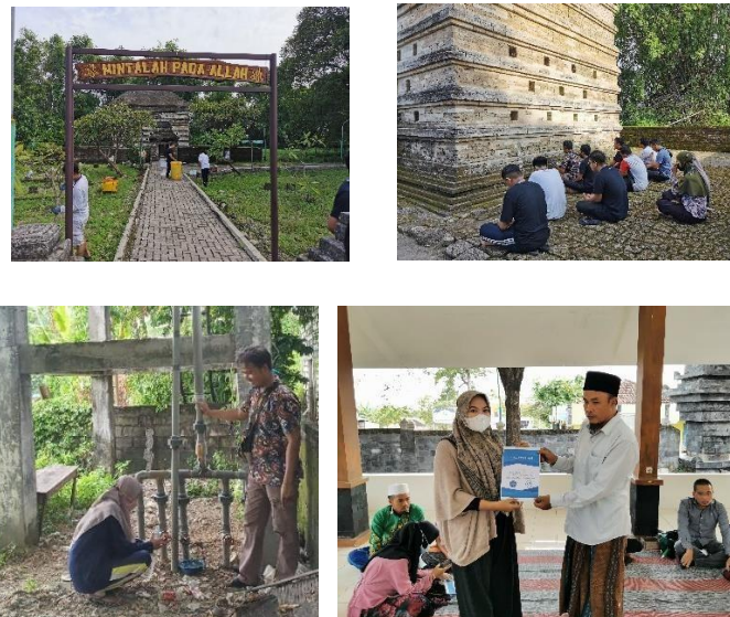
Gambar 4. Pelaksanaan Program Kerja Bidang Lingkungan

Hasil yang dicapai pada bidang ini adalah Peningkatan pengetahuan tentang kelayakan air HIPPAM, serta Peningkatan kebersihan dan terjaganya keindahan fasilitas dan lingkungan desa Leran .