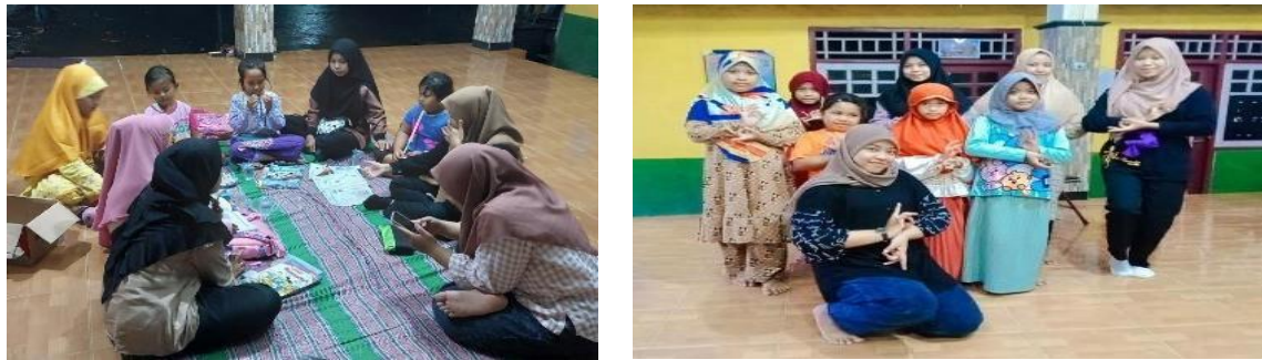
Gambar 2. Pelaksanaan Program Kerja Bidang Pendidikan

Program kerja dalam bidang pendidikan dan seni yang dilaksanakan selama KKN ini mendapat apresiasi dan respon positif dari masyarakat terkhusus guru – guru. Hal ini sangat membantu dan menambah jam pembelajaran yang sangat kurang selama ini. Siswa/i bersemangat belajar dan cukup membantu memfasilitasi anak – anak dalam menggali minat dan bakat mereka. Kesuksesan penyelenggaraan program kerja ini tidak terlepas dari peran serta dan bantuan guru – guru di MI Nurul Huda.