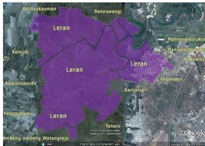
Gambar 1. Peta Lokasi KKN TEMATIK UMG 2021-2022

Kegiatan pengabdian masyarakat dalam bentuk KKN TEMATIK ini dilaksanakan selama 3 periode yaitu dibulan Januari - April 2022, bertempat di Desa Leran Kecamatan Manyar Kabupaten Gresik. (Gambar 1).