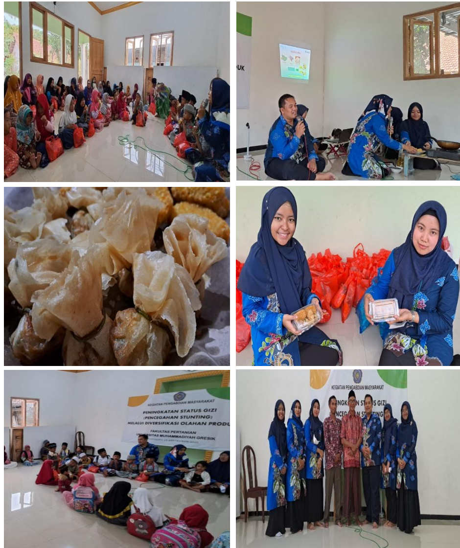
Gambar 2. Kegiatan PkM

Dari hasil kegiatan Pengabdian Kepada Masyarakat ini, dari hasil survey, peserta sosialisasi merasa kegiatan ini sesuai dengan harapan dan keinginan peserta sebelum mengikuti kegiatan ini. Adanya kegiatan PKM membantu peserta agar mampu mengantisipasi, mencegah, serta menanggulangi masalah stunting melalui penyajian makanan olahan sederhana yang memiliki status gizi yang baik. Gizi pada makanan olahan memiliki peran dalam peningkatan tumbuh kembang balita. Tumbuh kembang balita memiliki perubahan yang signifikan jika orang tua mampu mengimbangi dalam bentuk penyediaan makanan yang bergizi dan seimbang. Penyediaan makanan yang sesuai memungkinkan balita akan terhidar dari stunting, gizi buruk dan penyakit yang menyertai pada balita pada umumnya.