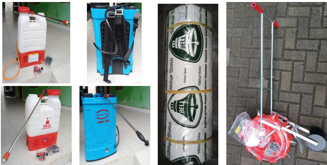
a. Alat semprot elektrik (Swan)