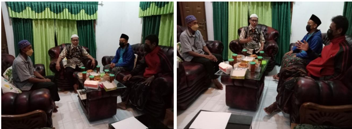
Gambar 1. Pertemuan ketua tim pengabdian dengan mitra

Pada pertemuan tersebut, tim pengabdian diwakili oleh ketua tim, dan dari mitra diwakili oleh ketua dan wakil ketua kelompok tani. Dalam pertemuan tersebut, juga hadir kepala dukuh Bakungan yang juga merupakan pelindung kelompok tani tersebut. Setelah musyawarah selama sekitar 90 menit, disepakati bahwa kelompok tani membutuhkan bimbingan dalam hal pertanian, khususnya padi, cabai, dan jagung. Suasana pertemuan tersebut ditunjukkan pada Gambar 1.