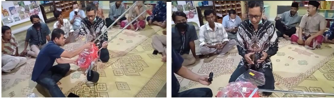
Gambar 6. Penyuluhan tentang mekanisasi pertanian dan penjelasan penggunaan alat-alat pertanian

Mekanisasi pertanian merupakan cabang dari ilmu Teknik Pertanian dengan pokok kajian berupa kegiatan usahatani (semua komoditas), kehidupan perdesaan, pengolahan hasil pertanian dan bentuk-bentuk kegiatan pertanian lain yang terkait dengan usaha tani (Handaka dan Prabowo, 2016). Penggunaan alat mesin pertanian (Alsintan) mampu menekan biaya usaha tani dan memberikan keuntungan bagi petani, sehingga mampu berkontribusi pada pencapaian swasembada pangan. Mekanisasi Pertanian mempunyai prospek yang baik kalau didahului dengan pemetaan kebutuhan dan ketersediaan serta langkah langkah kelembagaan ( enabling institutional environment ) yang memadai. Sebagai konsekuensinya biaya usaha tani dapat ditekan dan efisiensi usaha tani dapat diperbaiki (Aldilah, 2016). Publikasi di media massa online dari kegiatan ini dapat diakses di kumparan.com dengan link: https://kumparan.com/umylpm/1xwKrLoBPXt?utm_source=Desktop&utm_medium=copy-to-clipboard&shareID=C93PfqFSnf9K