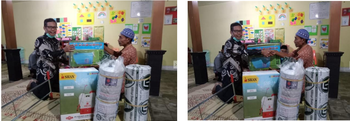
Gambar 4. Proses serah terima barang

ditunjukkan pada Gambar 4, sedangkan Gambar 5 menunjukkan barang-barang yang dihibahkan. Kegiatan serah terima barang ini didokumentasikan dalam bentuk video dan diunggah di kanal youtube dengan link: https://youtu.be/MAVoeGuwXRA .