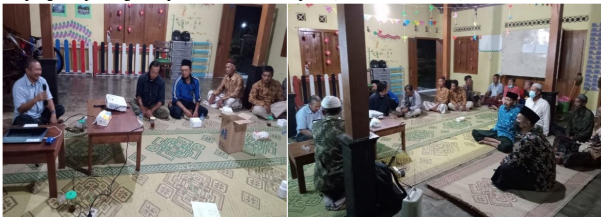
Gambar 2. Penyuluhan pertanian oleh praktisi

Di Indonesia, padi merupakan komoditas tanaman pangan penghasil beras yang merupakan makanan pokok dan sangat sulit digantikan oleh bahan pokok lainnya serta memegang peranan penting dalam ekonomi masyarakat (Donggulo, dkk., 2017). Namun demikian, nasib para petani tidak banyak berubah. Salah satu penyebabnya adalah rendahnya tingkat produksi (Wati, dkk., 2017). Oleh karena itu diperlukan upaya peningkatan Penerapan Dan Pengembangan Teknologi (PTT) Budidaya Padi Sawah. Menurut Badan Penelitian dan Pengembangan Pertanian Kementerian Pertanian, komponen PTT padi sawah meliputi teknologi dasar (1.VUB inbrida atau hibrida, 2.Benih bermutu/berlabel, 3.Bahan organik/kompos, 5.Populasi optimum, 5.Pemupukan berdasarkan status hara dan kebutuhan tanaman, 6.Pengendalian Hama Terpadu) dan teknologi pilihan (1. Olah tanah sesuai musim, 2. Bibit muda (<21 HSS), 3. Jumlah bibit 1-3 btg/rumpun, 4. Pengairan efektif/efisien, 5. Penyiangan (landak dll), 6. Panen tepat waktu dan gabah segera dirontok). Di sisi lain, penanganan Organisme Pengganggu Tanaman (OPT) Skala Kawasan, harus mendapatkan perhatian dari petani, agar memberikan kontribusi yang nyata, dan terukur terhadap program penanganan produksi usaha tani padi (Sholeh, dkk., 2019).