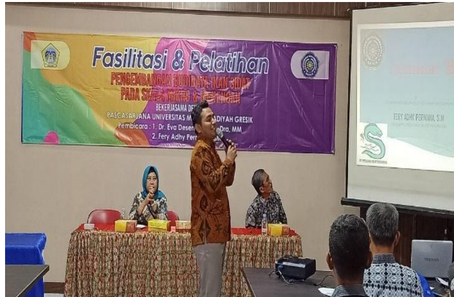
Gambar 4. Pelatihan dan Fasilitasi