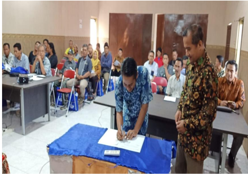
Gambar 2. Penandatanganan MOU/MOA antara Universitas Muhammadiyah Gresik dengan Kecamatan Kebomas Gresik disaksikan peserta pelatihan

sarana keberlanjutan implementasi program dimana kerjasama dilakukan untuk jangka waktu sampai dengan tahun 2024 (selama 5 tahun).