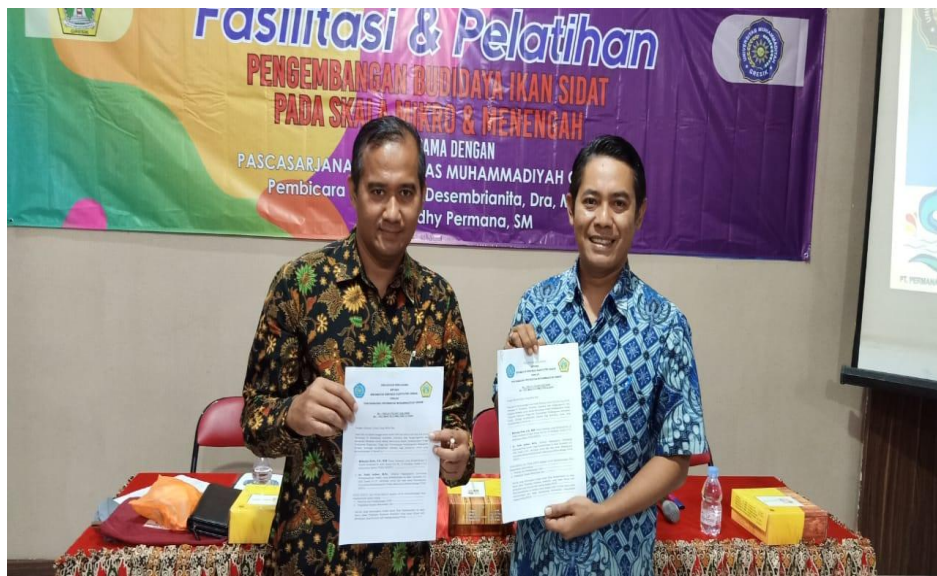
Gambar 3. MOU/MOA antara Universitas Muhammadiyah Gresik dengan Mitra PkM Kecamatan Kebomas untuk masa 5 tahun ke depan, tahun 2024