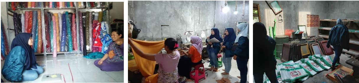
Gambar 3. Survey UKM

Persiapan dilakukan dengan cara survey yakni pengumpulan informasi awal tentang UKM yang dioperasikan oleh masyarakat Desa Banjarmadu dengan mengidentifikasi permasalahan yang mereka jalani. Pada tahapan persiapan ini juga dilakukan analisis kebutuhan atau pemecahan masalah yang kemudian penulis merumuskan konsep pembukuan seperti apa yang dibutuhkan oleh para pemilik UKM terkait dengan proses administrasi mereka.