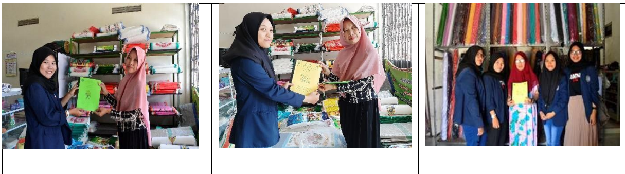
Gambar 5. Pemberian Buku Laba Rugi dan Buku Hutang

Penulis memberikan buku laporan keuangan laba rugi sederhana dan buku hutang yang bertujuan untuk memudahkan pemilik UKM (pengguna) dalam melakukan proses pencatatan. Buku ini dirancang dengan menggunakan konsep pembukuan sederhana agar pemilik UKM dapat menggunakan buku ini secara kontinyu . Buku laba rugi bertujuan untuk memudahkan pemilik UKM dalam mengetahui keuntungan ataupun kerugian yang diperoleh. Sedangkan buku hutang bertujuan untuk memudahkan pemilik UKM untuk mengidentifikasi pelanggan yang behutang sesuai dengan tanggal dan total hutang pelanggannya.