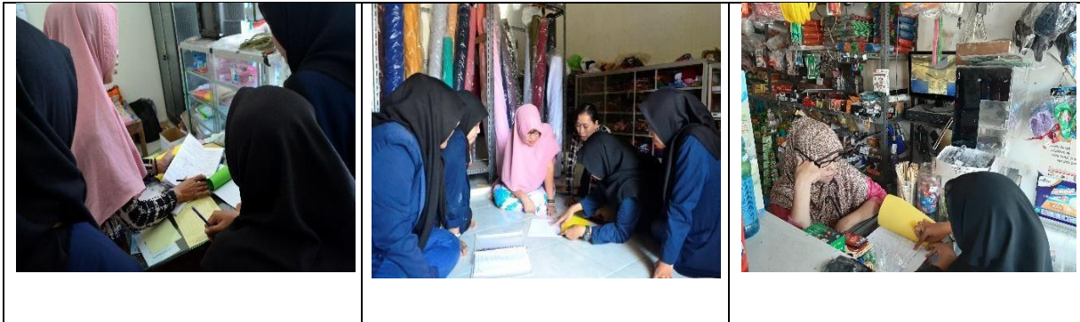
Gambar 4. Sosialisasi Pembukuan