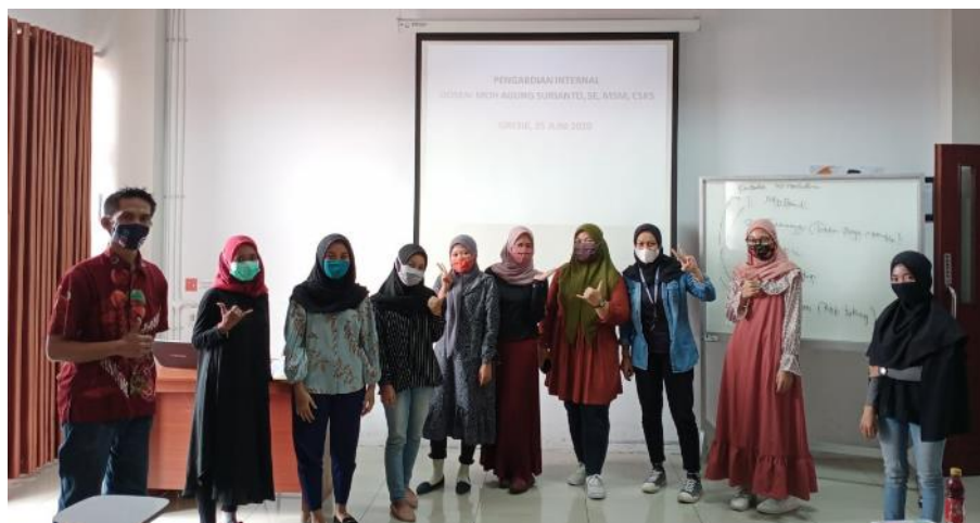
Gambar 2. Suasana Training

Tanggapan semua peserta sangat positif dalam sesi pelatihan yang langsung dilaksanakan di Kampus UMG. Peserta yang awalnya dominan berorientasi (bercita-cita) menjadi karyawan, akhirnya sebagian besar berorientasi menjadi wirausaha. Pandemi Covid 19 menjadi pembelajaran berharga bagi para peserta, bahwa meskipun menjadi karyawan tidak bisa dikatakan sebagai zona nyaman dan aman dibandingkan sebagai wirausaha. Sebagai wirausaha maupun pegawai sama-sama berada dalam zona tidak aman, ketidakpastian merupakan suatu keniscayaan.