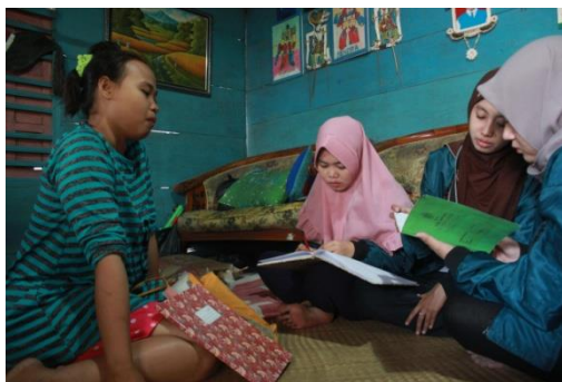
Gambar 3. Sosialisasi Mengenai Pembukuan Bank Sampah

Dalam proses pendampingan, pengurus bank sampah diberikan kesempatan untuk mengajukan pertanyaan-pertanyaan mengenai kesulitan yang dihadapi. Beberapa kesulitan yang dialami adalah memahami alur pencatatan pembukuan dari transaksi sampai laporan realisasi penjualan selanjutnya adalah laporan kas.