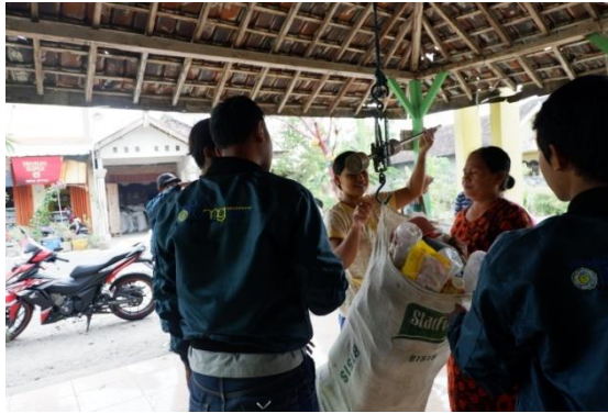
Gambar 4. Proses Penimbangan Sampah yang Dikumpulkan Warga