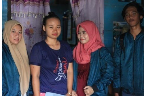
Gambar 2. Pertemuan dengan Pengurus Inti Bank Sampah