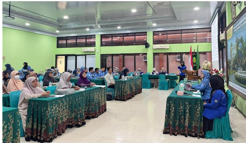
Gambar 2. Pemaparan Materi TOT oleh Dosen FKG UMS

Berdasarkan gambar di atas menunjukkan terdapat peningkatan pengetahuan kesehatan gigi dan mulut pada guru Pondok Pesantren Assalam setelah diberikan penyuluhan. Hal ini menunjukkan bahwa pemberian edukasi kesehatan gigi dan mulut menggunakan media power point terbukti efektif dalam meningkatkan pengetahuan masyarakat. Hal ini sejalan dengan penelitian sebelumnya (Herdyana, 2022; Ma'rufah Rohmanurmeta, 2022; Salsabila, 2022) yang menyatakan bahwa media tersebut memberikan efek positif dan dapat meningkatkan pemahaman dari responden (Khafid, et al. 2025).