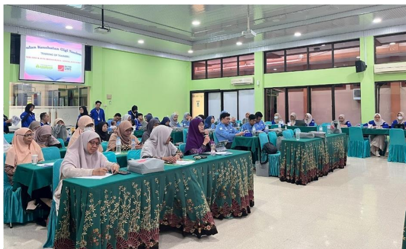
Gambar 3. Pengerjaan Pre-test Post-test materi TOT