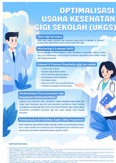
Gambar 5. Poster Optimalisasi UKGS

Evaluasi kegiatan dilakukan setelah pelaksanaan sesi edukasi dari FKG UMS, pengerjaan pre test dan post test . Evaluasi ini mencakup beberapa aspek, antara lain pemahaman guru terhadap konsep UKGS, kemampuan dalam melaksanakan kegiatan promotif dan preventif, serta keterlibatan mereka dalam mengintegrasikan edukasi kesehatan gigi ke dalam kegiatan belajar mengajar. Hasil evaluasi menunjukkan bahwa sebagian besar guru telah memahami pentingnya menjaga kesehatan gigi dan mulut serta peran strategis sekolah dalam mendukung program UKGS. Guru mampu menjelaskan kembali konsep dasar kesehatan gigi, seperti pentingnya menyikat gigi dua kali sehari, mengenali tanda-tanda kerusakan gigi pada