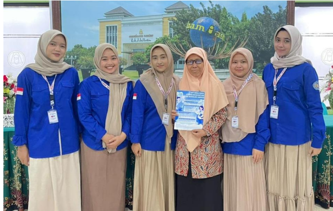
Gambar 4. Pemberian Poster Optimalisasi UKGS