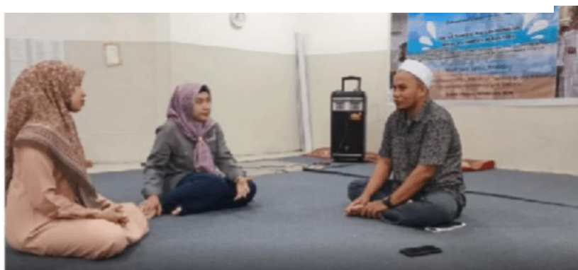
Gambar 3. Psikoedukasi Manajemen Kelas