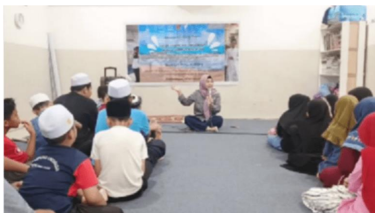
Gambar 4. Sesi Sosialisasi Kesehatan Mental dan Peer Support

Kegiatan sosialisasi kesehatan mental diberikan kepada semua siswa, dari mulai siswa yang berusia paling kecil 6 tahun hingga yang sudah berusia 15 tahun. Program ini dirancang dengan mengacu pada konsep literasi kesehatan mental yang meningkatkan kesadaran dan kemampuan identifikasi dini atas masalah psikologis pada anak dan remaja. Para siswa dikenalkan dengan apa itu kesehatan mental serta seberapa pentingnya kesehatan mental individu jika dibandingkan dengan kesehatan fisik. Kegiatan sosialisasi dilaksanakan secara interaktif dengan disertai proses diskusi dua arah sepanjang sesi sosialisasi. Di akhir sesi, terdapat pembagian suvenir bagi siswa yang aktif bertanya dan menjawab pertanyaan yang dilontarkan oleh tim pemateri.