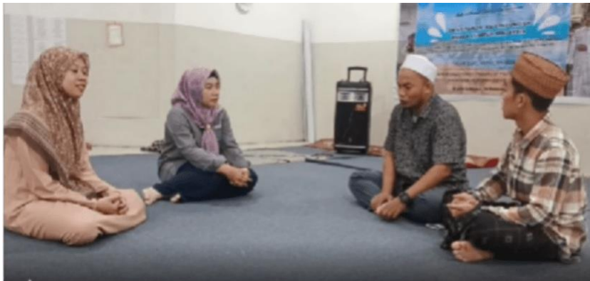
Gambar 2. Psikoedukasi Teknik Regulasi Emosi dan Pengajaran Berbasis Aksara pada guru