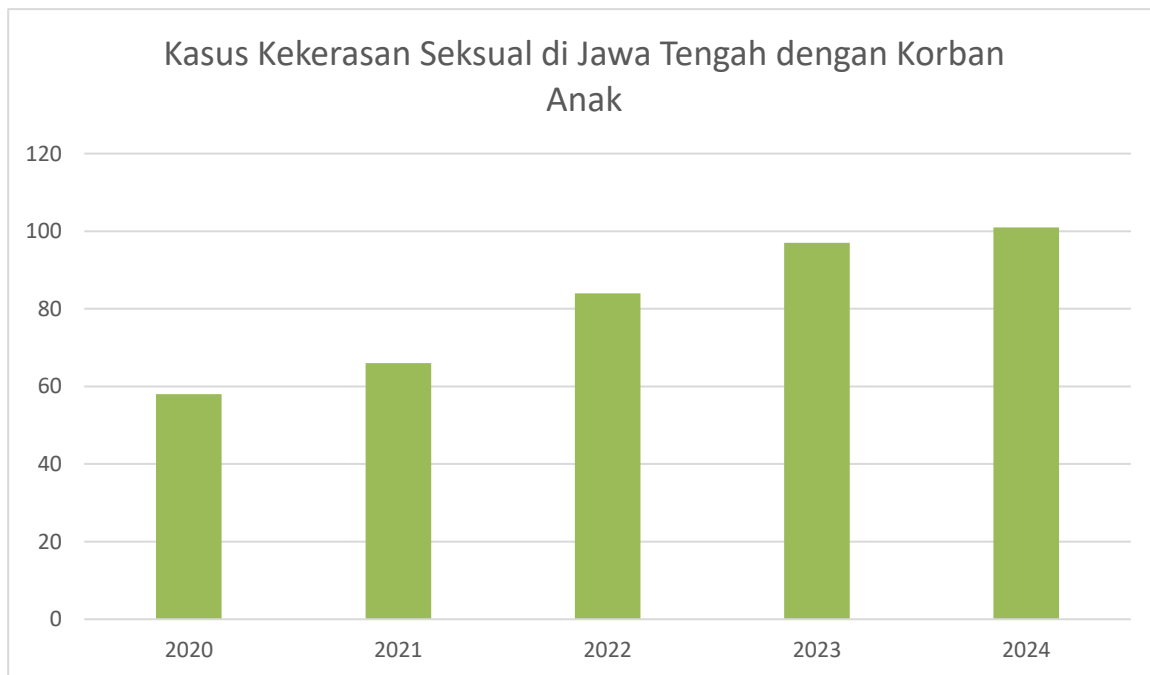
Gambar 1: Kasus kekerasan seksual dengan korban anak di Jawa Tengah tahun 2020-2024

Kasus kekerasan yang terjadi dengan korban anak di Jawa Tengah terjadi di berbagai tempat yang salah satunya adalah sekolah (Dinas Pemberdayaan Perempuan, Perlindungan Anak, Pengendalian Penduduk, dan Keluarga Berencana, 2024). Ketika jumlah kasus yang terjadi di tempat lainnya fluktuatif, kasus yang terjadi di sekolah terus meningkat. Pada tahun 2020, terjadi sebanyak 71 kasus; 2021 75 kasus; 2022, 88 kasus; 2023, 120 kasus; dan 2024, 140 kasus. Adapun spesifik terkait kekerasan seksual dengan korban anak, data setiap tahunnya adalah sebagai berikut (“Ringkasan Data Kekerasan Terhadap Perempuan Dan Anak,” 2026):