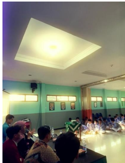
Gambar 3. Pemaparan materi oleh pembicara penyuluhan

Kekerasan seksual adalah setiap perilaku atau tindakan yang bersifat seksual yang dilakukan tanpa persetujuan, baik secara fisik, verbal, atau secara non-fisik. Adapun karakternya adalah memaksa dan memperkosa dalam konteks serangan seksual (Iswantoro Dwi Yuwono, 2015). Di antara contoh-contohnya adalah kontak fisik yang tidak diinginkan, kata kasar atau pelecehan verbal, eksploitasi atau pemanfaatan untuk kepentingan seksual, dan pemaksaan dengan ancaman atau bujukan. Sebagai fenomena, kekerasan seksual tampak seperti gunung es dimana yang tampak di permukaan tidak