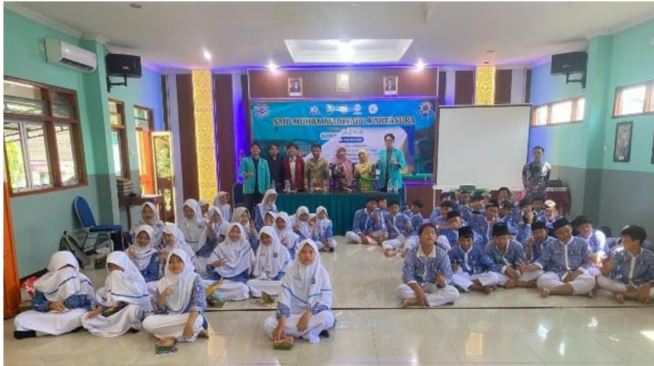
Gambar 4. Foto bersama pihak sekolah, mitra, pemateri, tim, dan peserta penyuluhan hukum