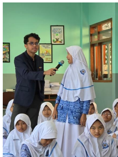
Gambar 7: pertanyaan dari peserta penyuluhan hukum