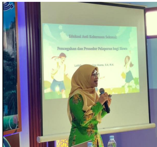
Gambar 5: materi tindak pidana dan bantuan hukum kekerasan seksual terhadap anak

Dari aspek hukum Undang-Undang No. 12 Tahun 2022 tentang Tindak Pidana Kekerasan Seksual (UU TPKS) hadir untuk mencegah kekerasan seksual; menangani, melindungi, dan memulihkan korban; melaksanakan penegakan hukum dan rehabilitasi pelaku; dan mewujudkan lingkungan tanpa kekerasan seksual serta menjamin ketidakberulangan kekerasan tersebut. Secara eksplisit terdapat sembilan jenis dari tindak pidana kekerasan seksual, yakni: