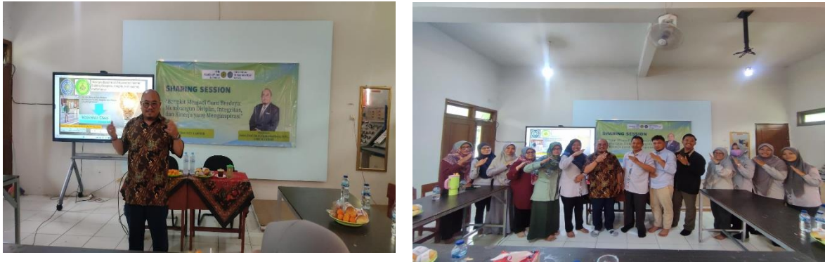
Gambar 2. Model Penyuluhan

Output yang diharapkan: Secara alami, budaya kerja yang produktif dan apresiatif akan berkembang.