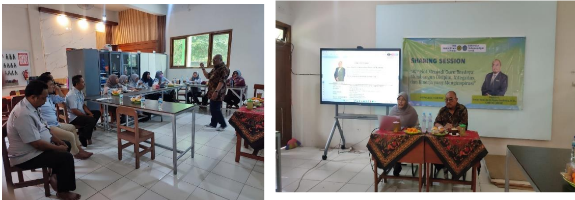
Gambar 3. Fucus Group Discussion