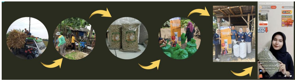
Gambar 2. Implementasi Agrofeedtech pada pakan ternak di kelompok ternak binangun raharjo