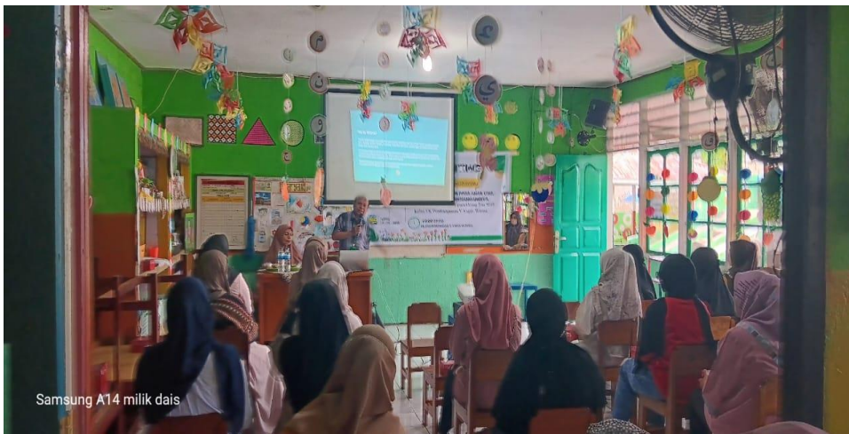
Gambar 3. Sesi tanya jawab peserta dan pemateri

Kegiatan penyuluhan menunjukkan tren peningkatan pada tahap pre kegiatan dan post kegiatan yang digambarkan pada warna biru dan merah (Gambar.1). setiap peserta menunjukkan peningkatan yang baik dalam memahami materi penyuluhan atau edukasi temper tantrum anak usia dini dan upaya penanganannya. Peserta memiliki antusias yang tinggi selama kegiatan hal ini ditunjukkan dengan berbagai pertanyaan dari mereka terkait materi penyuluhan. Bahkan setelah kegiatan beberapa ibu meinta nomor ketua pengabdian untuk melakukan konsultasi lanjut secara profesional karena beranggapan anak mereka masuk dalam kategori tantrum patologis. Suasana kegiatan menjadi sangat akrab dan menyenangkan karena sesi foto bersama dilakukan secara berulang dan berkelompok. Hal ini memberikan semangat bagi para guru dan tim pengabdian untuk merencanakan kegiatan serupa dengan topik yang berbeda tentang parenting di waktu yang akan datang.