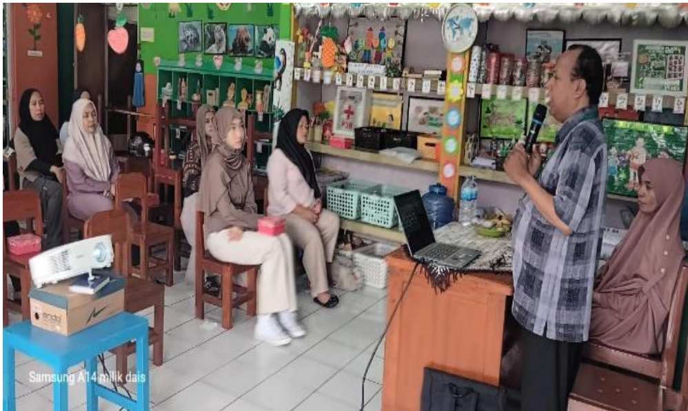
Gambar 2. Penyaji memberikan materi tantrum