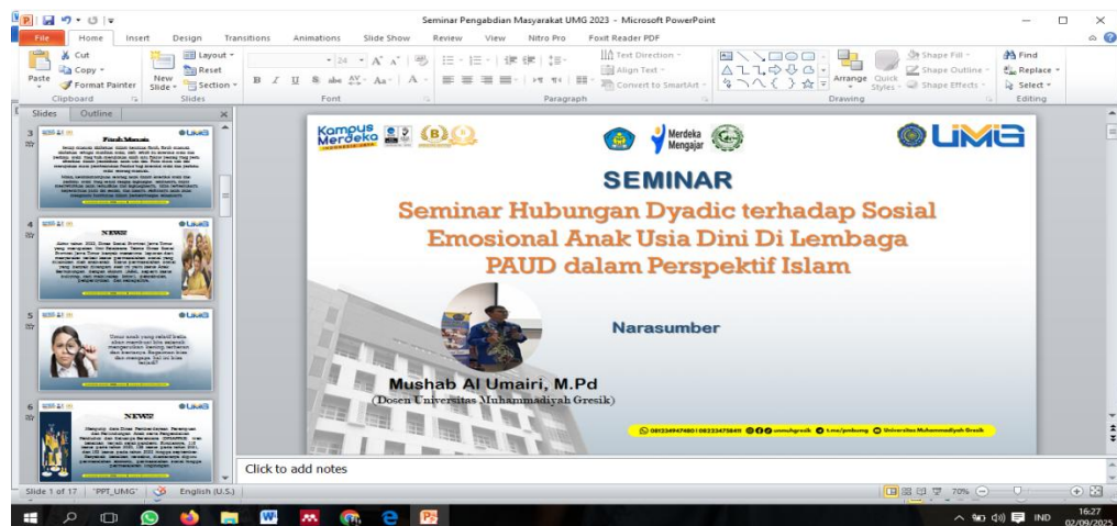
Gambar 3. Materi Seminar Pengabdian Di TK ABA 11 Giri