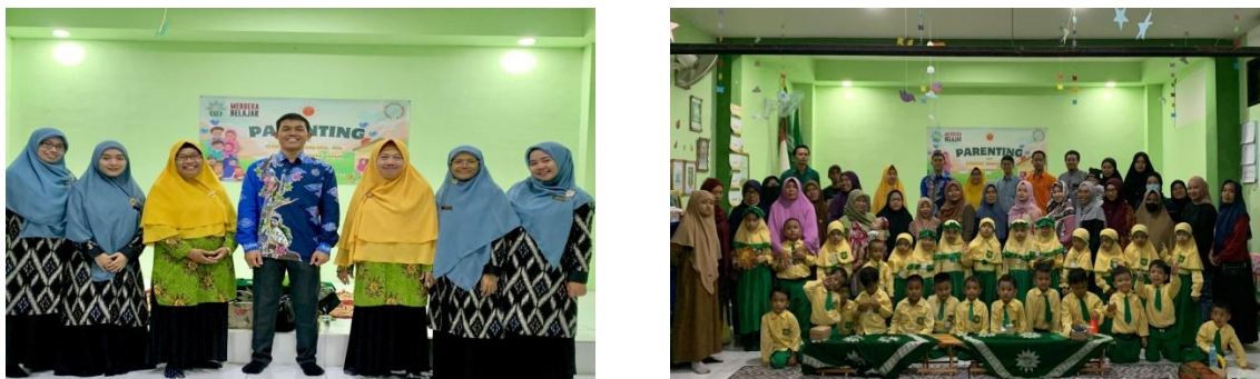
Gambar 2. Dokumentasi Kegiatan Seminar Dihadiri Ibu Ketua PCA, Guru, Wali Murid dan Peserta Didik TK ABA 11 Giri

Reaksi emosional yang tidak muncul pada awal kehidupan tidak berarti tidak ada, reaksi tersebut mungkin akan muncul dikemudian hari, dengan berfungsinya system endokrin. Kematangan dan belajar terjalin erat satu sama lainnya dalam mempengaruhi perkembangan emosi (Nurkhasyanah, 2024). Untuk mencapai kematangan emosi, remaja harus belajar memperoleh gambaran tentang situasi yang dapat menimbulkan reaksi emosional. Adapun caranya adalah dengan membicarakan berbagai masalah pribadinya dengan orang lain. Keterbukaan, perasaan dan masalah pribadi dipengaruhi sebagian oleh rasa aman dalam hubungan sosial dan sebagian oleh tingkat kesukaannya pada orang sasaran.