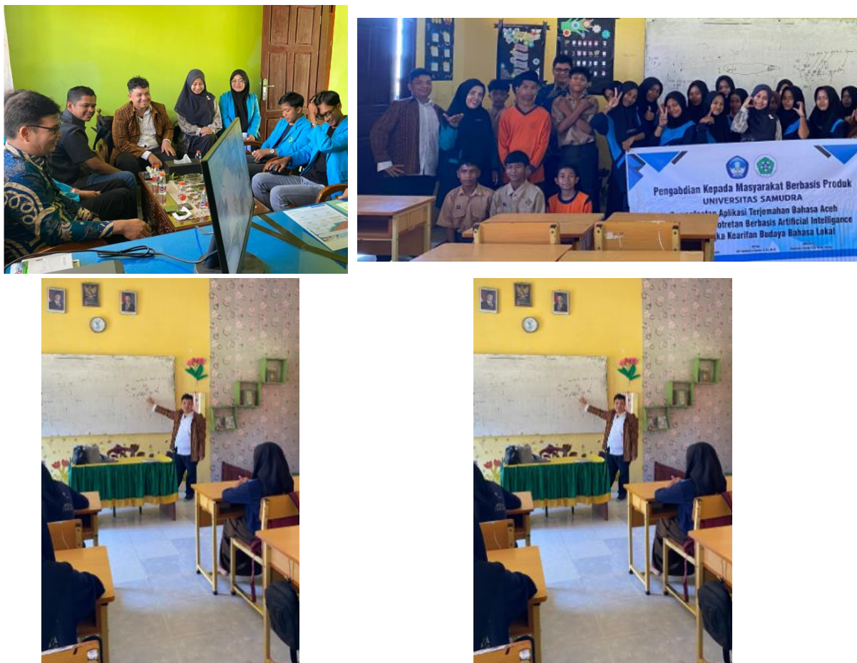
Gambar 2. Pelaksanaan Pengabdian kepada Masyarakat