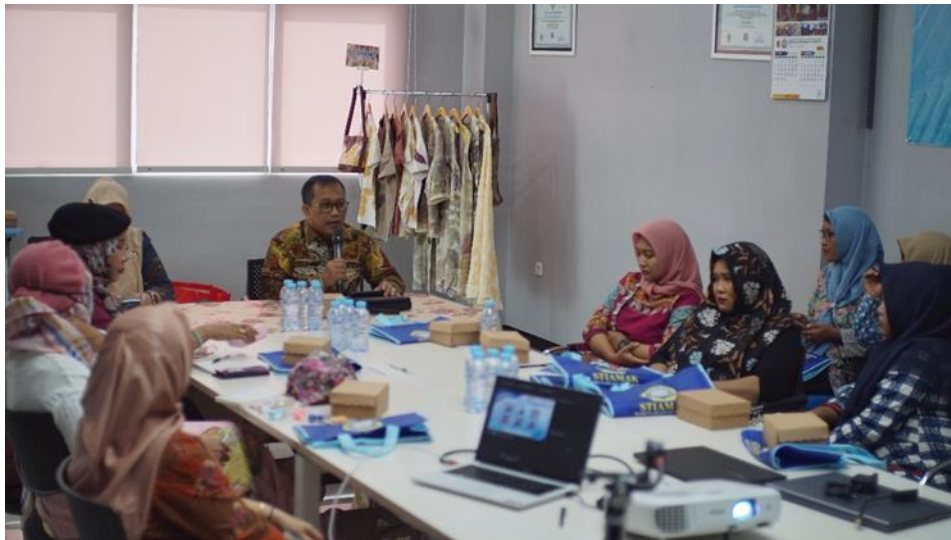
Gambar 3. Pembukaan Kegiatan Pelatihan

Rangkaian awal kegiatan pengabdian masyarakat adalah pemberian pelatihan kepada 10 pengrajin ecoprint sebagai pembangunan basis ilmu. Pelatihan tersebut dilaksanakan pada 7 September 2024 di STIAMAK Barunawati. Pelatihan yang diberikan meliputi bisnis model canva, pemasaran digital, pengemasan dan wawasan ekspor-impor. Empat wawasan dasar ini diberikan untuk memperkuat perencanaan dan operasional bisnis, meningkatkan daya saing pemasaran pada pasar online, dan legalitas serta daya saing di pasar ekspor.