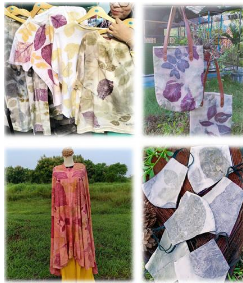
Gambar 1. Hasil Produk Ecoprint

Usaha Mikro Kecil Menengah (UMKM) UD Ridho Illahi merupakan usaha perorangan produktif, berbasis ekonomi kreatif. Produk yang dihasilkan bercirikan pada kearifan lokal menggunakan teknik ecoprint untuk menciptakan karya. Produk yang bercirikan pada kearifan local merupakan keunggulan yang dimiliki oleh UMKM UD Riho Ilahi yang diharapkan dapat memberikan peluang menciptakan ekonomi berkelanjutan dan memberdayakan ekonomi Masyarakat. Adapun produk yang dihasilkan berupa pakaian, tas, masker dengan bahan dasar dengan teknik ecoprint yang menggunakan bahan- bahan alami dan ramah lingkungan seperti daun dan bunga, untuk menciptakan pola dan warna pada kain. Metode ini mengedepankan keunikan setiap produk, karena setiap hasil ecoprint memiliki karakteristik yang berbeda, tergantung pada bahan yang digunakan.