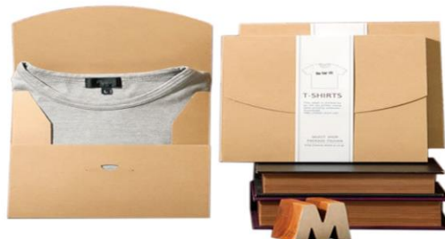
Gambar 5. Contoh Kemasan dari Website Gemapack

Chilman selaku perwakilan Gabungan Perusahaan Ekspor Indonesia (GPEI) menyampaikan materi tentang legalitas dokumen ekspor. Selain itu, Chilman juga menekankan tentang pengemasan produk yang menarik dengan standar ekspor. Aspek legalitas hukum khususnya dokumen ekspor memang cenderung sulit untuk difahami oleh para pengrajin. Berdasarkan hal tersebut, GPEI akan senantiasa mendampingi para pengrajin Ecoprint untuk membantu penyiapan dokumen legal ekspor. Para pengrajin mengikuti materi hingga tuntas dan terlibat diskusi dengan intens untuk memperdalam pemahaman bersama. Tidak jarang mereka menyampaikan pendapat khususnya dalam hal aplikasi langsung pada kertas kerja bisnis model canva dan dinamika pengelolaan media sosial serta E-Commerce