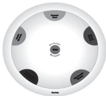
FIGURE 1.7 Exosystem

Konsep dasar ketiga exosystem ( exo yang berarti di luar), mengacu pada pengaturan di mana anak-anak tidak merupakan peserta aktif, tetapi faktor diluar mereka yang mempengaruhi perkembangan dasar seorang anak usia dini. Hal itu misalnya saja karena pekerjaan orang tua, organisasi yang diikuti orang tuanya atau juga jaringan yang diikuti oleh orang tua akan mempengaruhi anak. Dampak dari exosystems pada anak yang tidak langsung ini juga didapatkan melalui microsystems yang mereka dapatkan sebelumnya. Sebagai gambaran, ketika orang tua bekerja dalam suatu ruang lingkup pekerjaan yang selalu memakai pengaturan yang menuntut formalitas daripada diberi kesempatan berpikir secara mandiri, maka mereka mencerminkan orientasi ini dalam gaya pengasuhan mereka, dimana para orang tua cenderung untuk lebih suka mengendalikan daripada memberi kesempatan anaknya untuk berpikir secara demokrasi. Orientasi ini, pada gilirannya, mempengaruhi sosialisasi anak. Studi menunjukkan bahwa pekerjaan orang tua, pendapatan, dan kedisiplinan mempengaruhi hasil perkembangan anak.