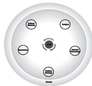
FIGURE 1.8 Macrosystem

dengan budaya, adat istiadat, keyakinan, gaya hidup dan interaksi social dimana anak tersebut dibesarkan. Budaya mengacu terhadap perilaku yang dipelajari, termasuk pengetahuan, kepercayaan, kesenian, sendi-sendi moral, hokum, adat istiadat dan tradisi yang merupakan karakteristik lingkungan social budaya yang merupakan kearifan local dimana seseorang anak tumbuh.